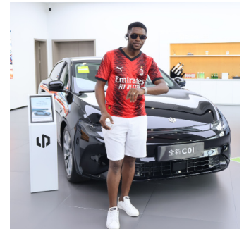
Iyo ni imodoka y'ubwoko C01, imwe mu zari zihuje gukorwa muri Leapmotor

riza ingendeshwa mu bihugu vyose harimwo n'ibihugu vy'i Burayi. Gushika mu mpera z'uyu mwaka wa 2024, iryo hinguriro ritegekanya kuzoba rifise ivyicarwo vy'ubudandaji 200 (200 points de vente) bikwiragiye mu mihingo itandukanye y'isi.