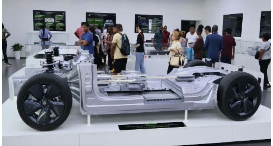
Iyo ni ishusho yerekana imodokari iriko irakorwa hamwe n'intambuko z'ibanze z'ikorwa ry'imodokari. Aho ni mu ruganda rw'imodoka LEAPMOTOR

Uburyo ico kibuga ccubatswemwo ni igitangaza. Kigize kuba kinini cane (gifise ubwinjiriro 3 aho ingenzi zishikira zikongera zigategerera indege), kikagira ubukomezi mu nyubako, kikagira isuku.