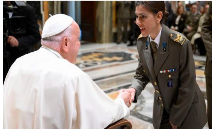
Papa Fransisiko ariko araramukanya n'abasirikare baje mu rugendo rweranda i Roma

Ubwa mbere: Yezu arabona. Mu gihe ishengero ryamubandanirako, banyotewe ijambo aribwira ryuzuye ubwitonzi, Yezu yakubitije akajisho ku barovy bihebuye kuko bari baraye bararoba ijoro ryose barabura. Arategera ingene babaye, imitima yabo igaragara nk'isenga zabo.