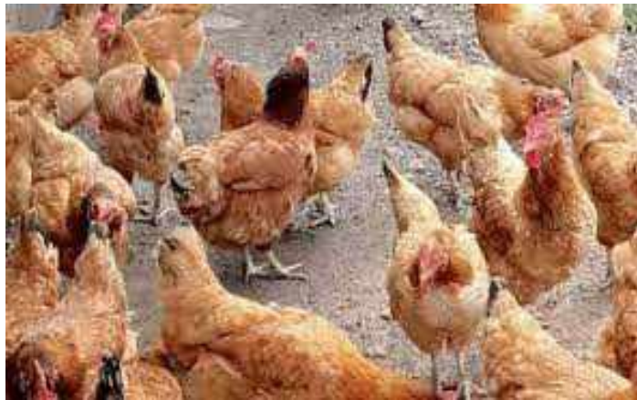
Dukure amaboko mu mpuzu tworore ibitungwa bitoboto (nk'inkoko) twiteze imbere

Ingingo ya 29 y'itangazo mpuzamakungu ry'agateka ka zina muntu ivuga