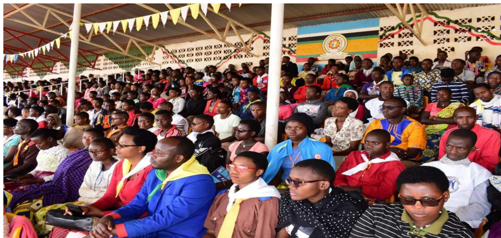
Bamwe mu rwaruka rwari rwitavye ihwaniro rigira 14 ry'Urwaruka muri Ekleziya y'i Burundi