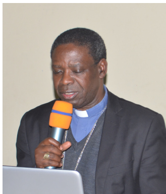
Musenyeri Georges Bizimana, Umwungere wa Diyoseze Ngozi akaba arongoye n'igisata Caritas mu nama nkuru y'Abepiskopi katolika b'i Burundi