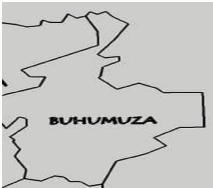
Intara ya Buhumuza ni imwe mu ntara zitanu zizoba zigize intara z'uburundi, kuva mu mwaka wa 2025

Izi ntara nazo ni zitanu, amakine 42, amazone 451 n'imitumba canke amakartiye 3044.