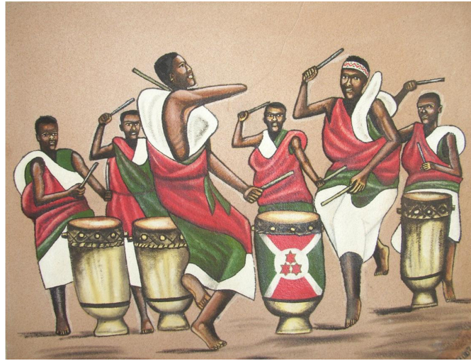
Ingoma z'i Burundi