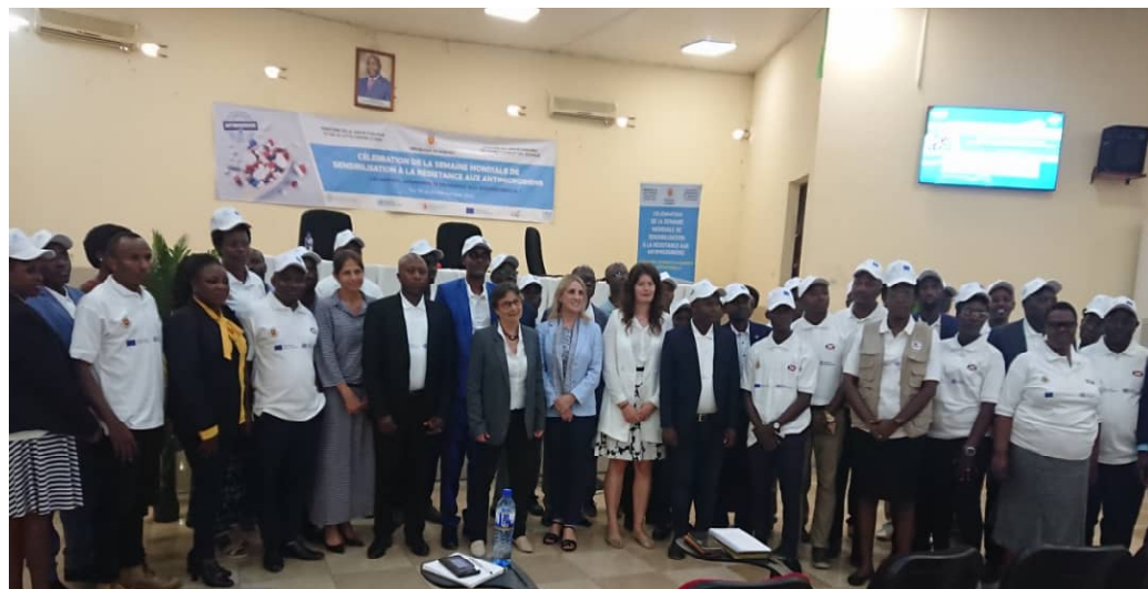
Bamwe mu bari bitavye ibirori vyo kwugurura indwi mpuzamakungu yahariwe guhimiriza ku ngaruka mbi zo gukoresha nabi imiti yica udukoko dutera indwara mu mubiri

hanyuma uwurwaye ntawukoreshe nk'uko muganga yawumwandikiye yabimutegetse;