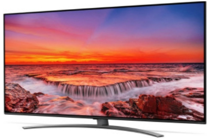
Iyi televiziyo yahabwa ikimenyeshamakuru uwabaye uwambere yaserukiye

bahabwa telefone yo mu bwoko bwa TECNO SPARK 10, iri mugaciro k'amafranga ibihumbi amajana atanu vy'amurundi (500 000FBu).