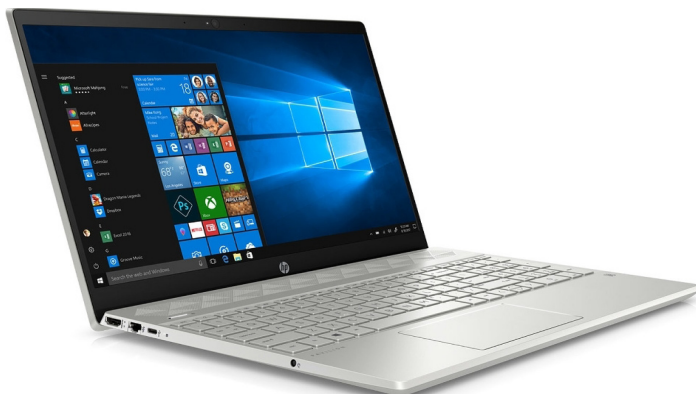
Iyi machine nyabwonko ngendanwa, yahabwa uwabaye uwa mbere

Kugeza muri uyu mwaka wa 2023, abarwayi barwaye iyo ndwara mu Burundi bangana ibihumbi 34, mu gihe ibihururu vyakozwe mu mwaka w'2013, vyerekana ko abarwaye iyo ndwara bangana ibihumbi 3.