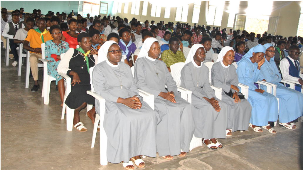
Bamwe mu banyeshule katolika biga mu makaminuza ku musi wo kwugurura indwi yabahariwe

Ku neuro igira 20, umuryango Katolika w'abanyeshule biga mu makaminuza atandukanye ari mu gisagara ca Bujumbura warateguye indwi yahariwe umunyeshule katolika yiga muri kaminuza. Ni kuva ku w'Imana igenekerezo rya 10 gushika ku wa 17 Rusama 2024.